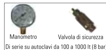
Manometro Valvola di sicurezza Di serie su autoclavi da 100 a 1000 lt (8 bar)